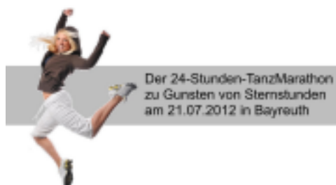
Der 24-Stunden-TanzMarathon zu Gunsten von Sternstunden am 21.07.2012 in Bayreuth

Sehr gerne begrüßen wir die Tänzerinnen und Tänzer, Trainerinnen und Trainer Ihres Vereines bei unserem TanzProjekt 2012, dem 24-Stunden-TanzMarathon zu Gunsten des Vereins Sternstunden am 21.07.2012 in Bayreuth. Eine Einladung hierfür liegt ebenfalls bei.