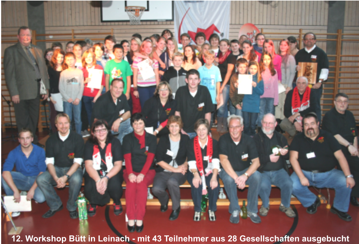
12. Workshop Bütt in Leinach - mit 43 Teilnehmer aus 28 Gesellschaften ausgebucht

Am 04.11.2011 war es endlich wieder soweit. Der 12. Workshop Bütt in Unterfranken startete im Jugendhaus Leinach. Schon Wochen vorher fanden über Facebook in der Gruppe Leinach die ersten Absprachen einiger Teilnehmer zu diesem Event statt.