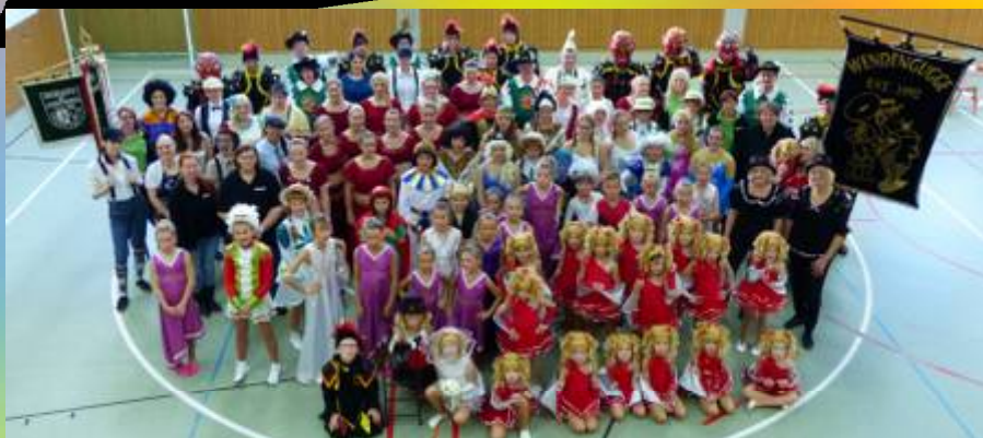
Die Aktiven Grün-Weiß Wendelstein