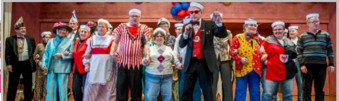
Prunksitzung für Menschen mit und ohne Handicap der FG Bayreuther Mohrenwäscher