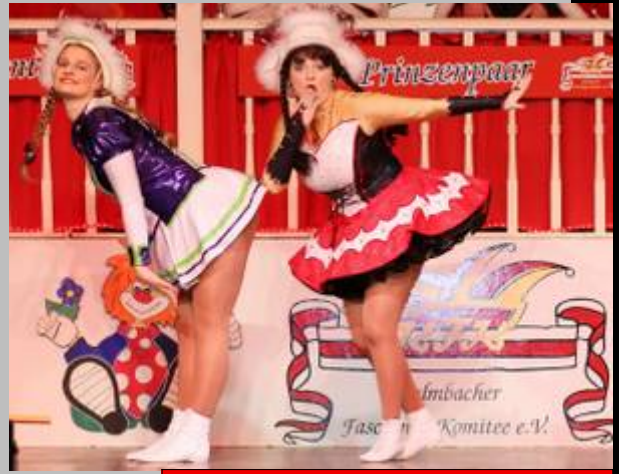
"Ranzmariechen" - KFK Kulmbach