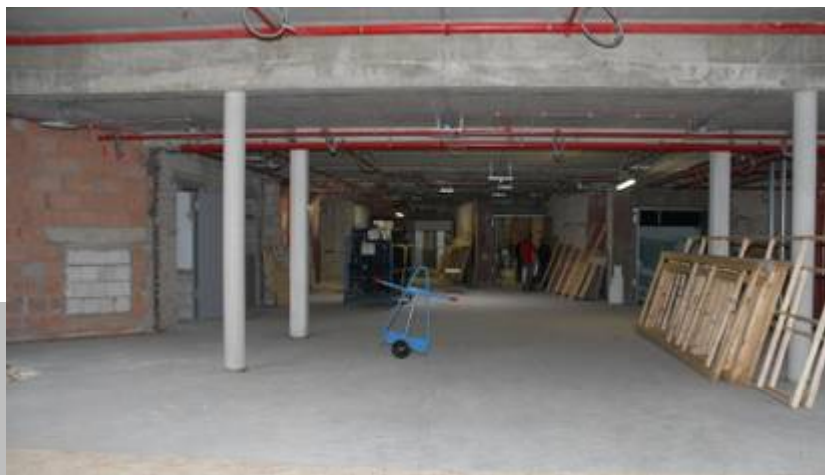
Der Eingangsbeich - noch reine Baustelle!

Im Januar 2015 werden die Bauarbeiten endgültig abgeschlossen sein, aber auch davon wird der Zuschauer nichts merken, wenn es am 6. Februar heißt: "Herzlich willkommen zur Fastnacht in Franken, live aus den Mainfrankensälen Veitshöchheim".