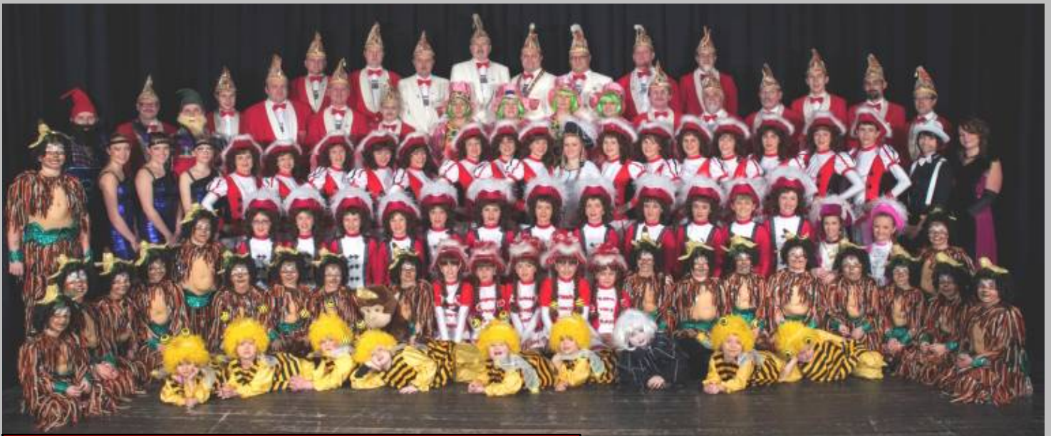
Gemeinsam sind wir stark! Gruppenbild der KG Narhalla Rot-Weiß Marktredwitz