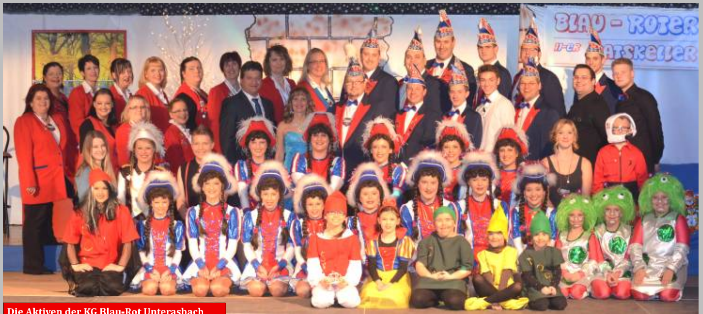
Die Aktiven der KG Blau-Rot Unterach