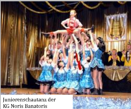
Juniorenschautanz der KG Noris Banatoris