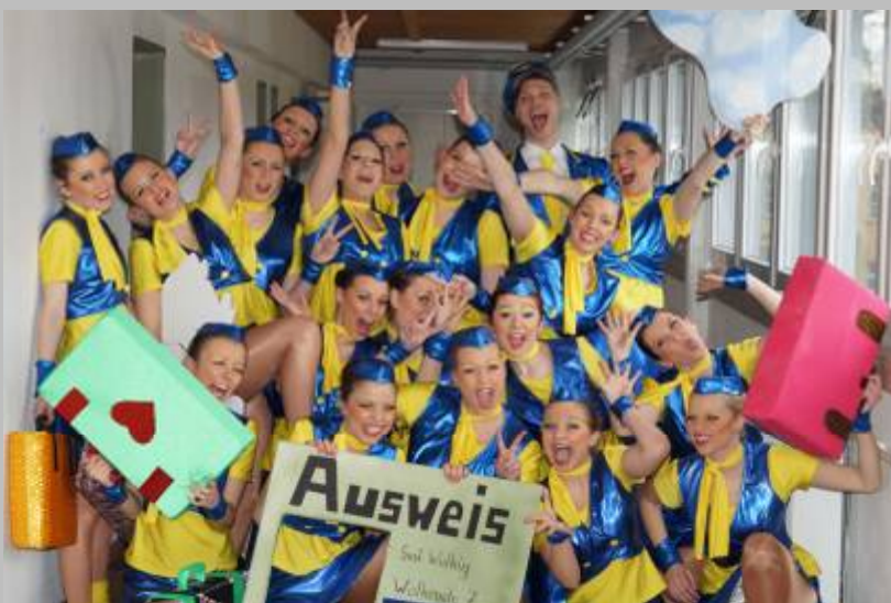
Vor dem Auftritt! Schautanz der AWO Tanzgruppe Grün-Weiß Oberviechtach