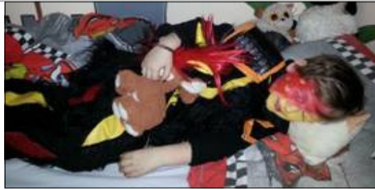
Nach dem Auftritt: Nachwuchstrommler Grün-Weiß Wendelstein