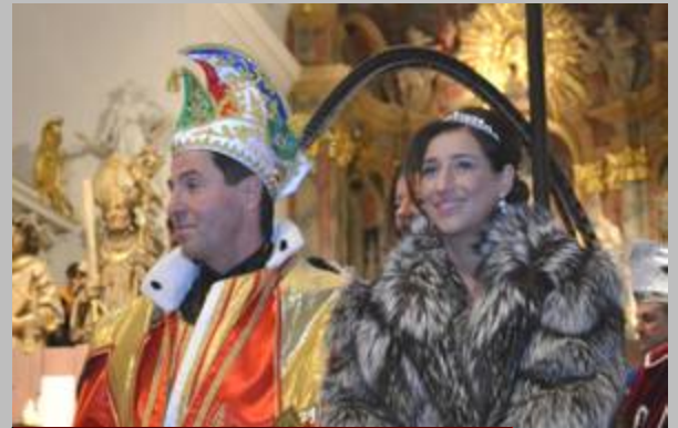
Das Würzburger Prinzenpaar Fotograf Daniel Büttner