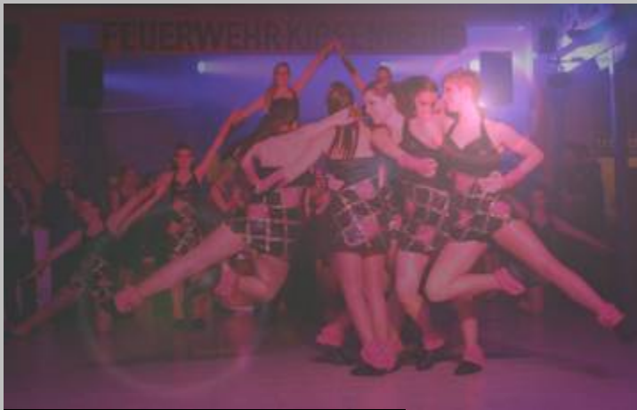
Schautanz - Die Fasenickl Kipfenberg