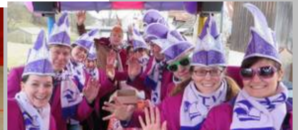
Organisationsteam - Mitterteicher Gaudiwurm e. V.