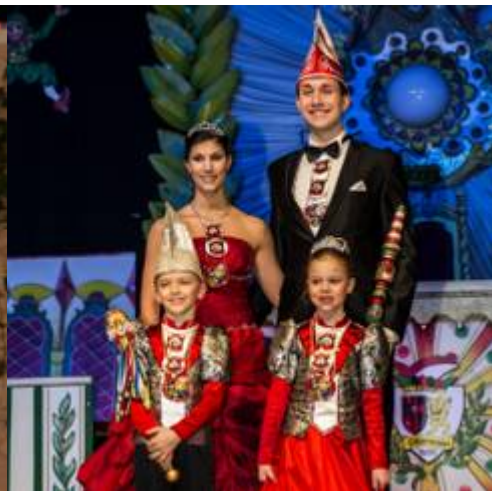
Die Prinzenpaare der Eibanesen Nürnberg