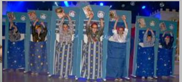
Prunksitzung der Ritter vom Hahn Trunstadt