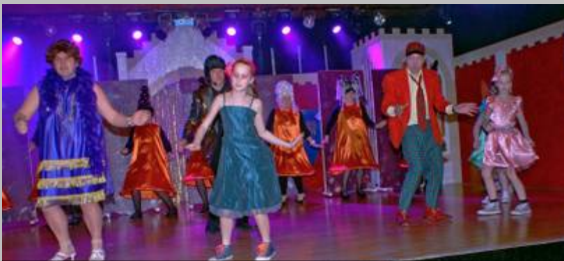
Prunksitzung der Ritter vom Hahn Trunstadt