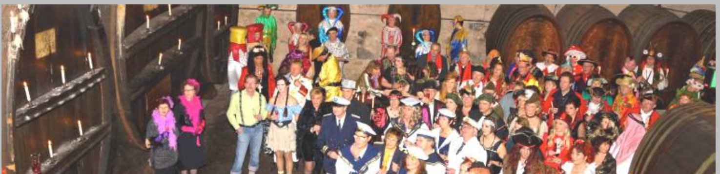
Närrische Weinprobe 2014