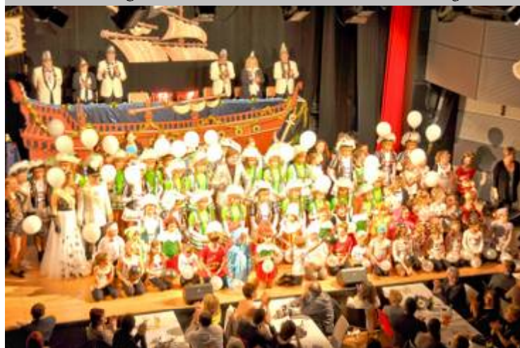
Anfangsbild Jubiläumsprunksitzung Bayreuther FG Schwarz-Weiß