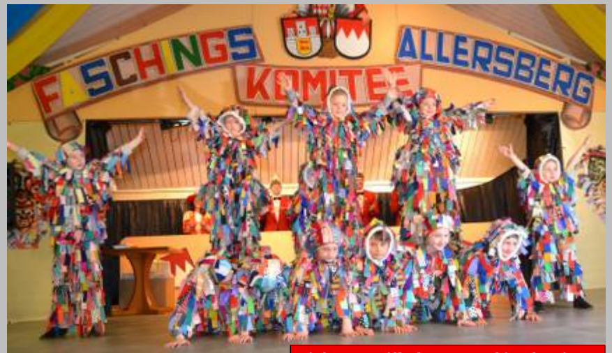
Mini Hexen - Allesberger Faschingskomitee