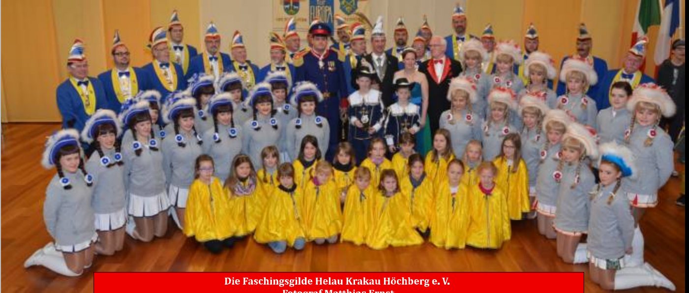
Die Faschingsgilde Helau Krakau H6chberg e. V.