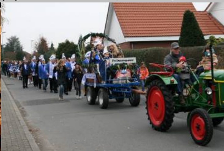
Prinzenwagen Närrische Sandhasen Bettingen