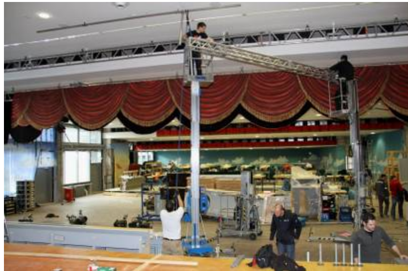
Aus der unverputzten Halle wird das karnevalistische Märchenschloss!

Mit viel Herzblut und Engagement zauberten die Mitarbeiter des Bayerischen Fernsehens aus einer leeren nicht verputzten Halle das karnevalistische Märchenschloss zu Veitshöchheim.