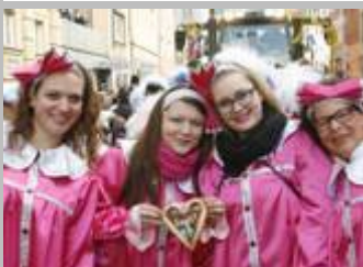
Umzug in Würzburg - TSG Veitshöchheim