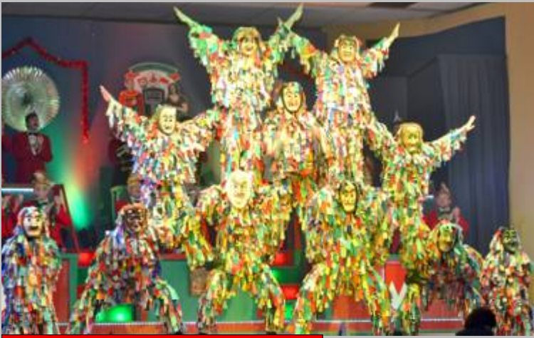
Hexen - Allersberger Faschingskomitee