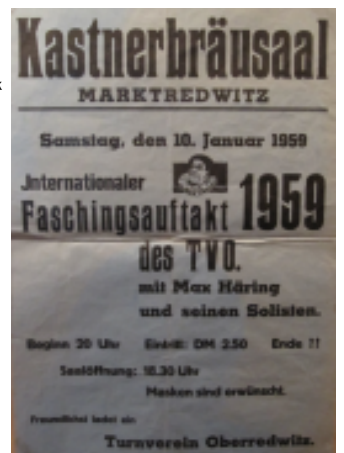
Bericht: Marco Anderlik

Geöffnet ist das Rawetzer Narrenkästchen jeweils am Faschingssamstag und natürlich auf Anmeldung. Als „Museumswärter“ fungiert mit Jörg Auer ein Urgestein des Rawetzer Faschings.